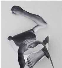
Anja Buchheiser, Roundabout, 2012, impresión digital intervenida, dimensiones variables

En el centro de la exposición está la instalación en la que nuestros hábitos de mirar se salen de los rieles. Vemos la reproducción fotográfica de un árbol, la copa del árbol y el tronco. La superficie fotográfica sugiere a primera vista una tridimensionalidad, sin embargo apenas uno se mueve en la sala, se da cuenta que se trata de una ilusión. La reproducción del árbol es bidimensional, sobre papel, y por el tipo de instalación se transporta a la tridimensionalidad. El árbol se comporta como un dibujo transferido dentro de la sala. Para Anja se trata de superficie, linealidad, efecto espacial, con una mirada modificada cuando nos movemos en el espacio. Cuando usted camina alrededor de la instalación, ve que el inverso no está imprimiendo. Pintura, reproducción, corporalidad y superficie se mezclan según la posición del observador.