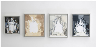
Christiane Pooley, Going back to Venice, 2009, óleo sobre tela, marro, cuatro partes, dimensiones variables, dimensión total: 40 x 120 cm

Su punto de partida es una especie de modelo visual el cual trata en pintura de maneras diferentes y usando diversas variantes.