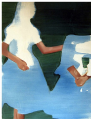
Christiane Pooley, Subtly it stopped and ceased to be light , 2012, óleo sobre cartón, 62 x 69 cm

De manera similar, las pinturas de Christiane Pooley nos muestran una ilusión la cual se restituye a sí misma. Sin dibujos preparatorios y de un modo intuitivo, ella crea escenas figurativas, que nos hacen incluso pensar en collage. Aun cuando la artista chilena trabaja algunas zonas en dibujos, otras quedan más libres en términos de color y espacio, incluso vacías revelando la superficie del material. Algún lugar entre figuración y abstracción, las misteriosas y atmosféricas pinturas de Christiane Pooley están inspiradas por la historia del arte de diferentes maneras. Aun cuando estas pinturas son "objetos físicos", ellas nos ofrecen un lugar íntimo para la imaginación.