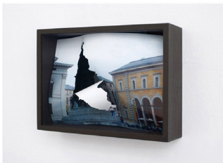
Anja Buchheiser, Touch me II, 2012, impresión digital intervenida, marco. Edición: 3 + 1 AP, 35 x 25 x 10 cm

Este juego de construcción o bien desconstrucción de espacios y el movimiento entre superficie y espacio, es decir bi- y tridimensionalidad, también se puede ver en las cajas-objetos. Es una serie que comenzó el 2008 bajo el título Touch Me. Anja Buchheiser traspasa fotografías propias a cuerpos tridimensionales en estas cajas - objetos. Una vez más, la realidad representada se corta y se curva y el resultado predeterminado de cada uno de los elementos del cuadro, se define nuevamente.