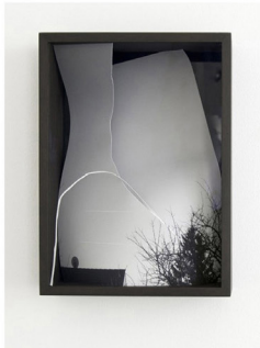
Anja Buchheiser, Touch me IV, 2012, impresión digital intervenida, marco, 35 x 25 x 10 cm

Quisiera terminar con una frase del sociólogo francés Gustave Le Bon: