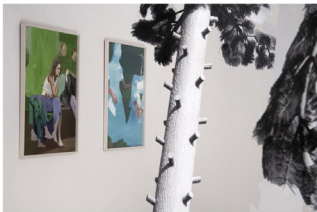
Vista de instalación.

Anja Buchheister transmuta el medio fotográfico a la tridimensionalidad, interpretándolo a través de la escultura y la instalación, a veces complementándolo con dibujos. Temas diversos como el autorretrato, la arquitectura o las plantas son fotografiados directamente por la artista y resueltos en un nuevo ambiente, produciendo que éstos entren a diálogo de manera bastante los unos con los otros. Cortes, pliegues y composiciones inusuales en sus fotografías desafían la perspectiva espacial y obligan al espectador a cuestionarse, de manera lúdica, su posición en tanto que observador. Aun cuando Anja Buchheister nos muestra fragmentos de lo cotidiano de un modo realista, ella nos hace reflexionar sobre su imaginario.