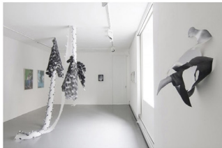
Vista de instalación.

Este pliegue, enrollar, cortar y retorcer de la aparente realidad, usted también lo puede ver en la obra Roundabout (2012). Aquí tampoco se trata del puro retrato en sí, sino que del traspaso de una forma, a la sala. La artista misma se transforma en cuerpo tridimensional a través de la fotografía, en un portarretrato bidimensional. Este sugiere corporalidad, pero en realidad es plano. Por medio del recorte y enrollado y la transferencia a la sala, se convierte hápticamente en tridimensional.