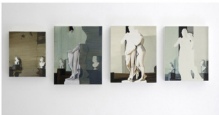
Christiane Pooley, Corpo e Anima después de Canova, 2011, óleo sobre tela, cuatro partes; dimensiones

Así surgen entonces estos cuatro trabajos a partir de una misma imagen la cual es desmembrada capa por capa durante el proceso pictórico, como diferentes maneras de comprender, por medio de la pintura, la profundidad de la escultura. Pueden ser como en este caso situaciones arquitectónicas, escenas de paisajes, o también determinadas posiciones corporales, como Ous for left eye (2011).