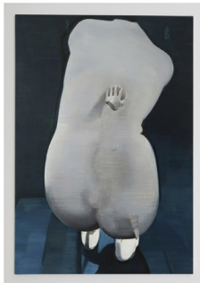
Christiane Pooley, Casting my eyeballs, 2012, óleo sobre tela, 122 x 84 cm

La investigación de la relación entre espacio y figura, figura y superficie, superficie y color, le interesa a Christiane no sólo formalmente, sino que también tiene para ella un aspecto emocional. Su obra Casting my eyeballs (2012), nace a partir de una escultura anónima, seguramente madre e hijo. La mano del niño (no es montaje) y otros dos puntos de contacto son visibles en la espalda de la mujer, son los únicos vestigios de la unión entre ambas figuras. Me parece que esta pintura ilustra muy bien este aspecto de presencia y ausencia en su trabajo.