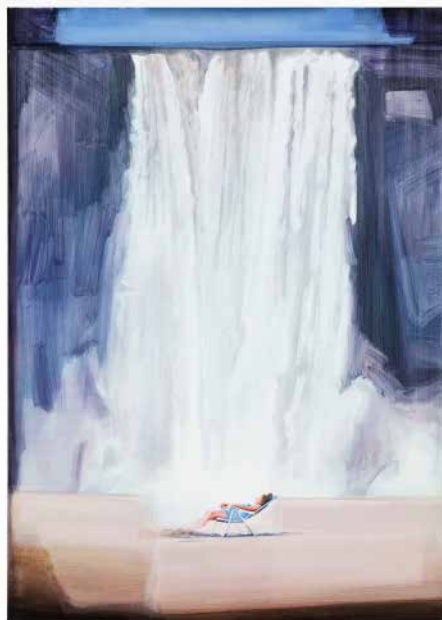
You And I Are Earth (Tú y yo somos tierra), 2021 Studio Christiane Pooley Oil on canvas 140 x 100 cm

personas a quienes les regalaron tierras. Hoy en Chile hay un juicio muy fuerte y por el hecho de ser agricultor se pasa a ser culpable o sospechoso. Entonces algunas personas se sienten con el derecho de atacarlos. Como artista tengo la posibilidad de visibilizar realidades y ponerlas en perspectiva, intentar mostrar el lado humano y el dolor que genera el conflicto. Me tomó varios años poder trabajar con imágenes de la casa de mi infancia destruida en un ataque incendiario en 2014 en Temuco, cuando en medio de la noche, cinco bombas explotaron en su interior. Más doloroso que la destrucción de una casa para mí fue la destrucción simbólica de un hogar y de los vínculos que nos unen como sociedad.