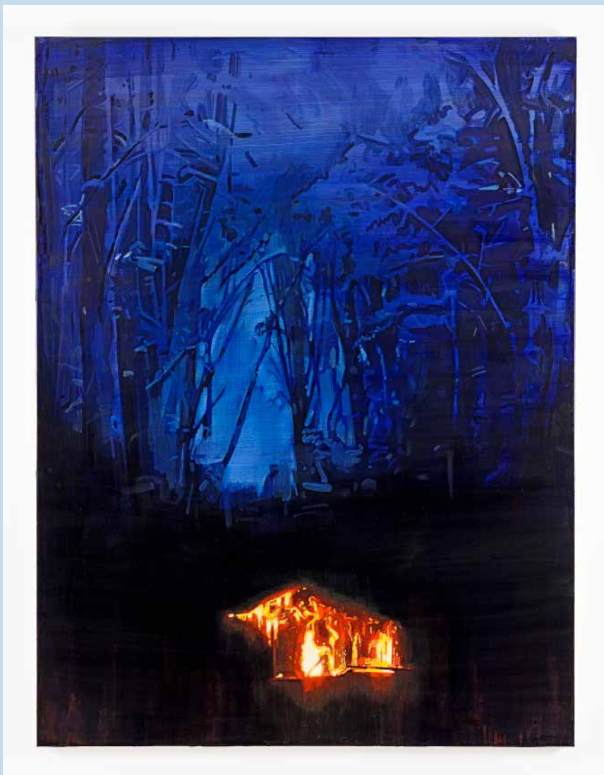
Back Home, 2017 Studio Christiane Pooley Oil on canvas 165 x 125 cm