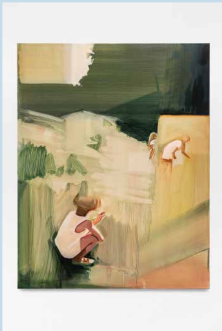
Yo me sé tres poemas de memoria, 2019 Studio Christiane Pooley Oil on canvas 140 x 110 cm