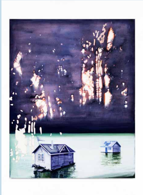
The familiar stars from our latitudes (Las estrellas familiares de nuestras latitudes), 2021. Studio Christiane Pooley Oil on canvas. 140 x 110 cm

Sobre el soporte, entendido como territorio, Christiane compone espacios atmosféricos, interiores y exteriores, que oscilan entre la abstracción y la figuración. El suyo es un lenguaje que desdibuja las categorías rígidas, deja en suspenso las afirmaciones y certezas, rehúye los dogmatismos y defiende los claros-curos; es una pintura que se ubica en el lugar de la pregunta, que escenifica contradicciones y diferencias en un campo de relaciones abiertas.