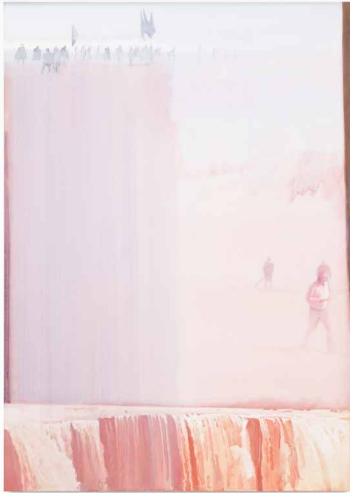
La copia feliz , 2021 Studio Christiane Pooley Oil on canvas 140 x 100 cm