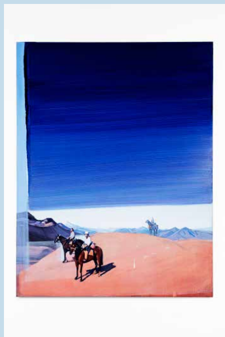
The wind blows in circles ( El viento sopla en círculos), 2021 Studio Christiane Pooley Oil on canvas 116 x 89 cm