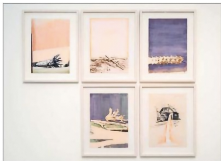
Sus trabajos mezclan técnicas de dibujo, óleo y acuarela, para dar a conocer paisajes de La Araucanía.