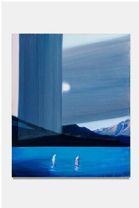
Profundidad (Depth), 2022 - 2023. Oil on canvas. 73 x 60 cm. Courtesy of the artist and Perrotin