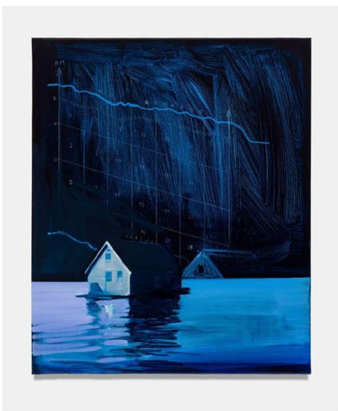
Río Renaico, 2022. Oil and pencil on canvas. 46 × 38cm. Courtesy of the artist and Perrotin

畫時所用到的景深，亦不只是實質距離的遠近，而是一個現實與想像的距離，看穿了時間與空間的界限。Christiane的畫作打破了「風景畫」的定義，它們畫的不是細緻的景色——遠看會以為畫得很細膩，但近看就見到風景及人物所用到的筆觸的強烈對比。藝術家筆下的風景很多都是「大刀闊斧」的，明顯而俐落的三兩下大筆一揮，清晰又大膽的brush stroke足以畫出山與地，輕鬆建構出大環境；有趣的是「風景」之中不時見到奇特的形狀，就好像突然有塊俄羅斯方塊將思緒毅然斬斷一樣；藝術家所畫的天空也有這個傾向，卻多了一點gradient，多了一點層次。但最有趣的還是跟「主角」的對比，倘大的風景 / 背景中就只有那麼小不點似的人物，但往往大家的目光卻不期然地落在這些人物上：細看之外，它們卻是沒有臉孔的、甚至特意畫得很模糊，好像拍照的時候失了焦一樣——特地畫出motionless的身體，它有生命嗎？它有身份嗎？它有靈魂嗎？