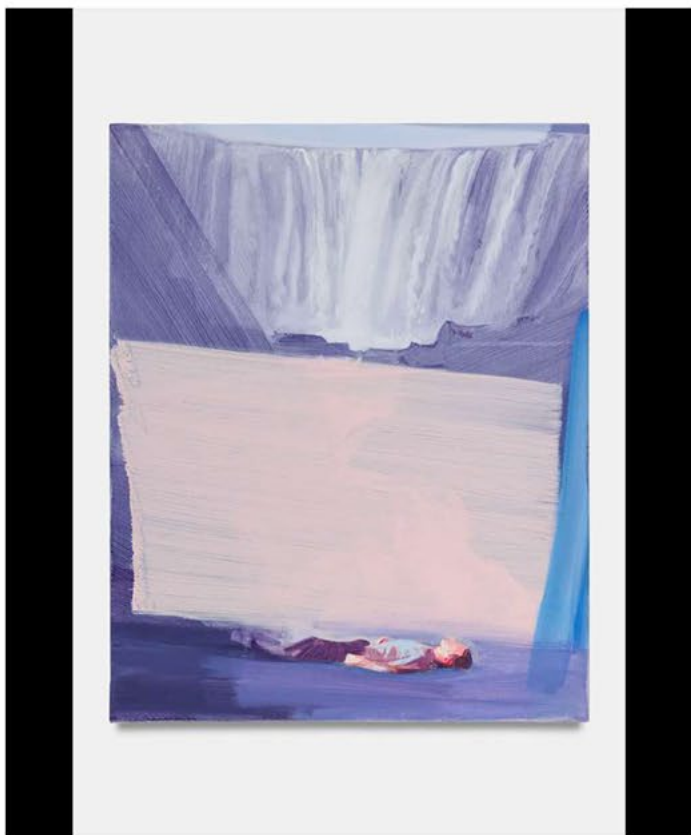
Gravedad (Gravity), 2023. Oil on canvas. 50 × 40 cm.

震撼彈的一個展覽，筆者敢說是Best of the Year的其中一個展覽，由即日起至10月14日展出，錯過了敢說會是一個遺憾。