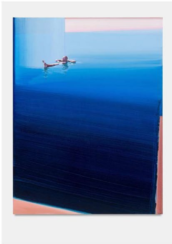
Traces of feelings, 2023. Oil on canvas. 165 × 125 cm. Courtesy of the artist and Perrotin