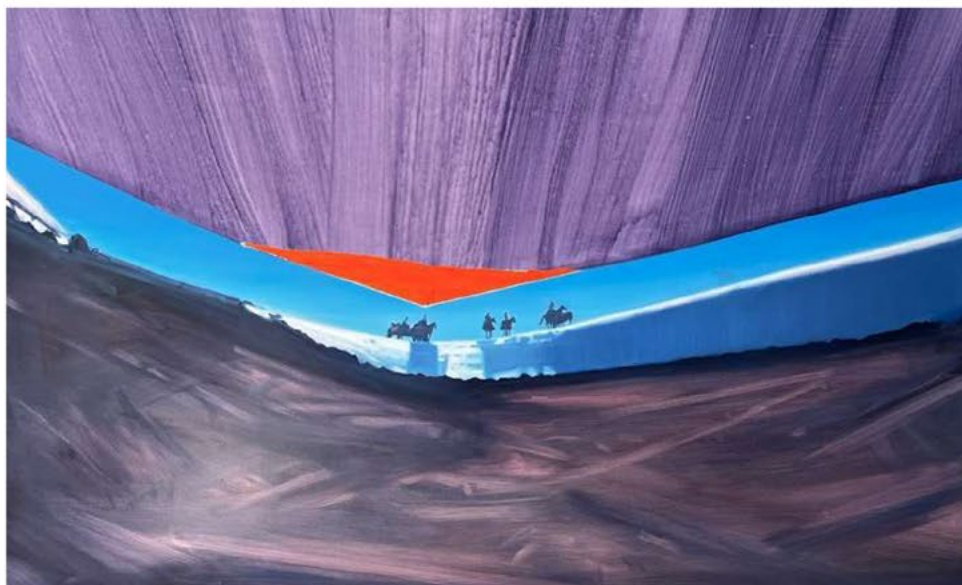
Life is elsewhere, 2023. Oil and watercolor on canvas. 170 × 260 cm.

一系列畫作特別之處是Christiane本是按照家中相冊或智利的國家歷史檔案所畫的，但正如藝術家從小所感受到的身份認同危機一樣，畫作在真實與虛幻之間，質疑「照片」及歷史的虛實，質疑自身與collective的身份。舉個例說，在《Rio Renaico》（2022）一畫中，水中的兩間屋正好代表了Christiane來自智利南部的一個傳統——在安第斯文化的社群中有個儀式叫Minga或Mink'a，大概意思是當一家人要「搬屋」，族群就會一起幫助這家人literally將整幢「家」由一個地方移到新一處，是來自智利南部的一種游牧式的居住方式。這個方式除了在很多層面上與現代性的精神相悖之外，天空上的一格格grid其實是當年殖民政府將原居民的地劃分之後要他們「買」回土地，藝術家就在一幅畫作中描繪了歷史的矛盾、及（近乎意想不到的夢境般的）傳統與現代的演化。同時，透過這幅「風景」畫，Christiane質問了一個概念，就是如果風景也會被擁有、奪去再販賣，族群可以被編寫與改寫，如果居住者不能真正「擁有」風景，那麼我們還可以「帶走」什麼？可以用什麼來確立我們的身份？套一句來自Perrotin的說話，「它們（畫作）在不同場景的調和中，最後被轉譯成了前現代和現代之間的相互切換。Christiane的繪畫完美印證了風景的政治性。」